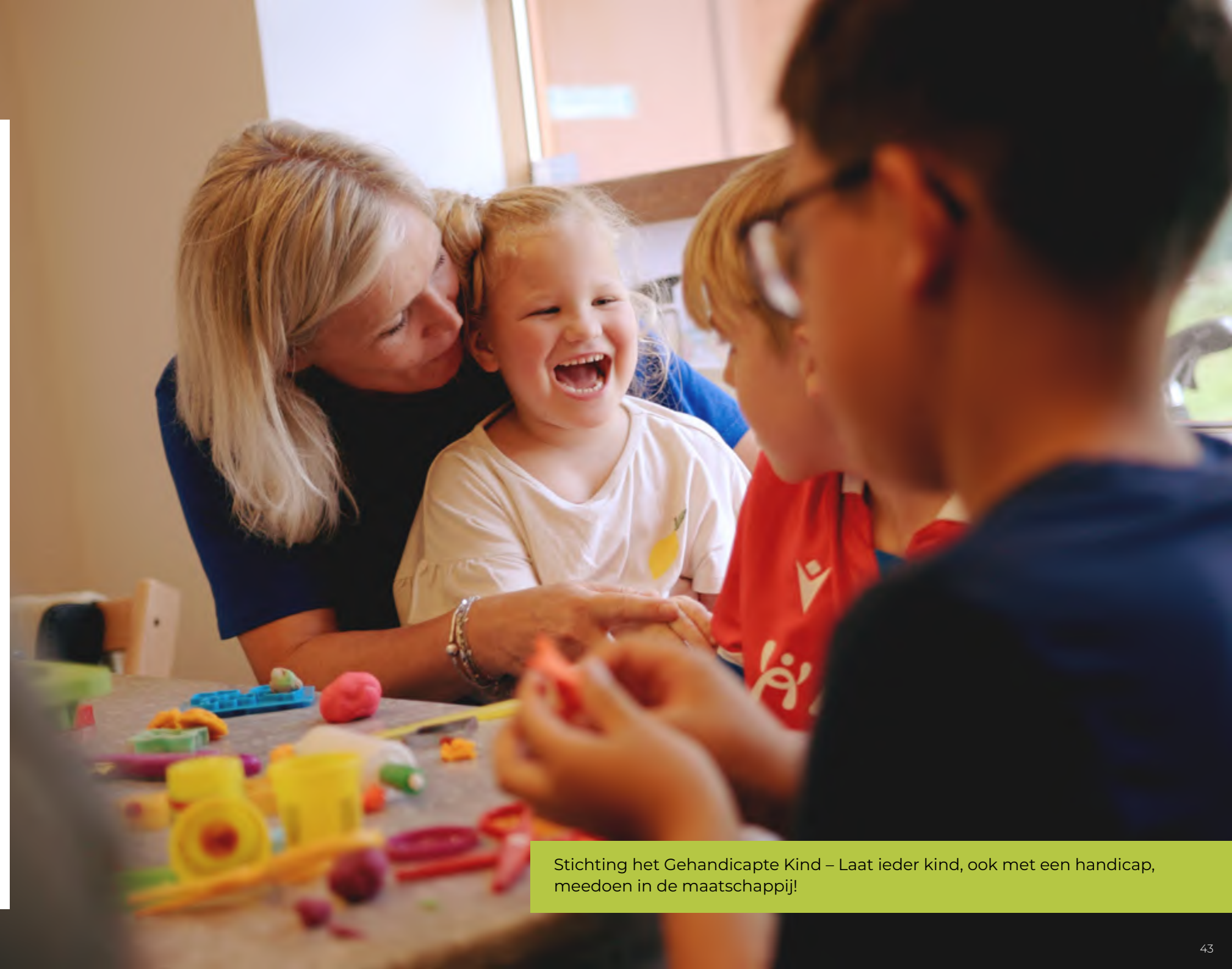
Stichting het Gehandicapte Kind – Laat ieder kind, ook met een handicap, meedoen in de maatschappij!

Kinderen met een beperking gaan vaak naar een speciale school ver van huis. Of ze gaan helemaal niet naar school. Daardoor ontmoeten ze nauwelijks andere kinderen. Samen naar School, een initiatief van Stichting het Gehandicapte Kind, laat zien dat dit anders kan. Een Samen naar School klas biedt kinderen met complexe ondersteuningsbehoeften de kans om zich op een reguliere basisschool te ontwikkelen. In een apart klaslokaal krijgen kinderen met een handicap alle zorg en ondersteuning die ze nodig hebben. Waar het kan, sluiten ze aan bij de reguliere klassen. Inmiddels zijn er vijftig Samen naar School klassen en kunnen 10.000 kinderen, met en zonder handicap, samen leren en opgroeien.